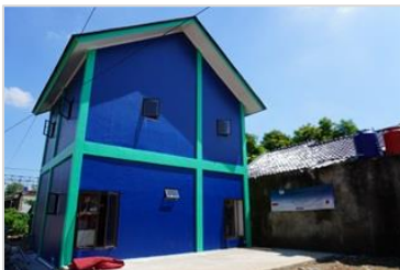
建築研修センター