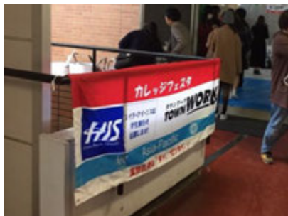
愛知淑徳大学（星ヶ丘）