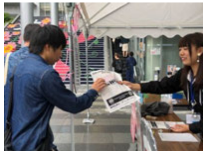
東海学園大学（名古屋）