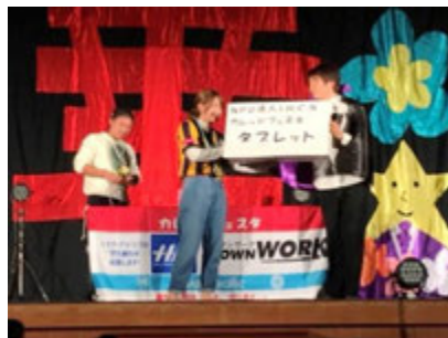
愛知工業大学（八草）