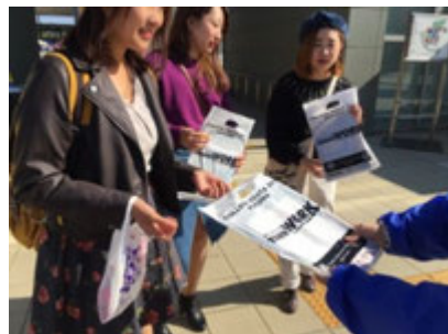
名古屋市立大学（桜山）