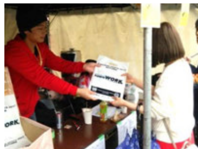
名古屋学院大学（白鳥）