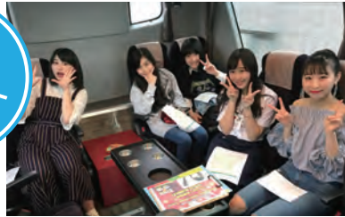
Panstar Land Cruise号で出発!